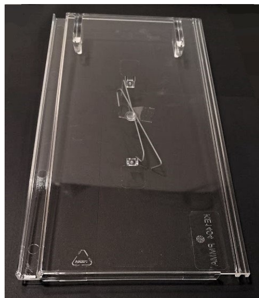
Prosvětlovací taška Steinbrück KL 1404

Prosvětlovací tašky jsou určeny k prosvětlení nezatepleného podkroví (jako např. průmyslových a technických hal, překladišť ale i jízďáren, atd.) a půdních prostor, kde zajišťují přívod denního světla. Tašky jsou tvarovány pro konkrétní typ krytiny, což umožňuje velmi snadnou montáž a harmonickou integraci prvku do střešní plochy jak jednotlivě, tak pro rozšíření prostupu světla sériově. Montáž lze řešit v případě potřeby i dodatečně. Taška je vyrobena z transparentního UV stabilního polyakrylátu s téměř 100% propustností denního světla. Součástí dodávky jsou příchytky tašky pro ukotvení za lať. Tašky nejsou vhodné pro prosvětlení obytných, zateplených prostor.