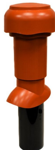
Venduct® Dlouhá odvětrávací roura s Odvodem kondenzátu KE8009-1