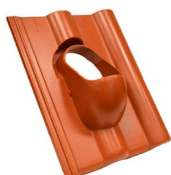
Prostupové tašky pr.100 mm